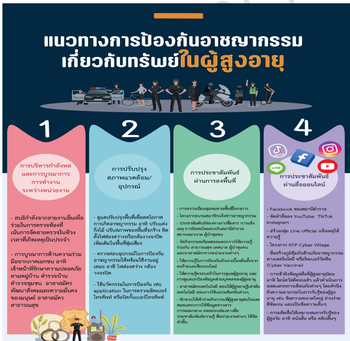
ภาพที่ 2 แนวทางการป้องกันอาชญากรรมเกี่ยวกับทรัพย์สินในผู้สูงอายุ

ในการดำเนินการป้องกันอาชญากรรมปัจจุบัน ซึ่งเป็นการป้องกันอาชญากรรมในภาพรวม การดำเนินการส่วนใหญ่มีการบูรณาการร่วมกันทั้งเจ้าหน้าที่ตำรวจ พนักงานฝ่ายปกครอง พนักงานสาธารณสุข มีความร่วมมือกันทั้งหน่วยงานภาครัฐและเอกชนรวมถึงอาสาสมัครในชุมชน ซึ่งจากการวิเคราะห์ข้อมูลที่ได้ในการสัมภาษณ์เชิงลึกและการสนทนากลุ่ม ผู้วิจัยได้นำเสนอแนวทางการป้องกันอาชญากรรมเกี่ยวกับทรัพย์สินในผู้สูงอายุออกเป็น 4 ประเด็นด้วยกันคือ 1) การบริหารกำลังพลและการบูรณาการการทำงานระหว่างหน่วยงาน 2) การปรับปรุงสภาพแวดล้อม/อุปกรณ์ 3) การประชาสัมพันธ์โดยการลงพื้นที่ และ 4) การประชาสัมพันธ์ผ่านสื่อออนไลน์ นำเสนอตามภาพที่ 2